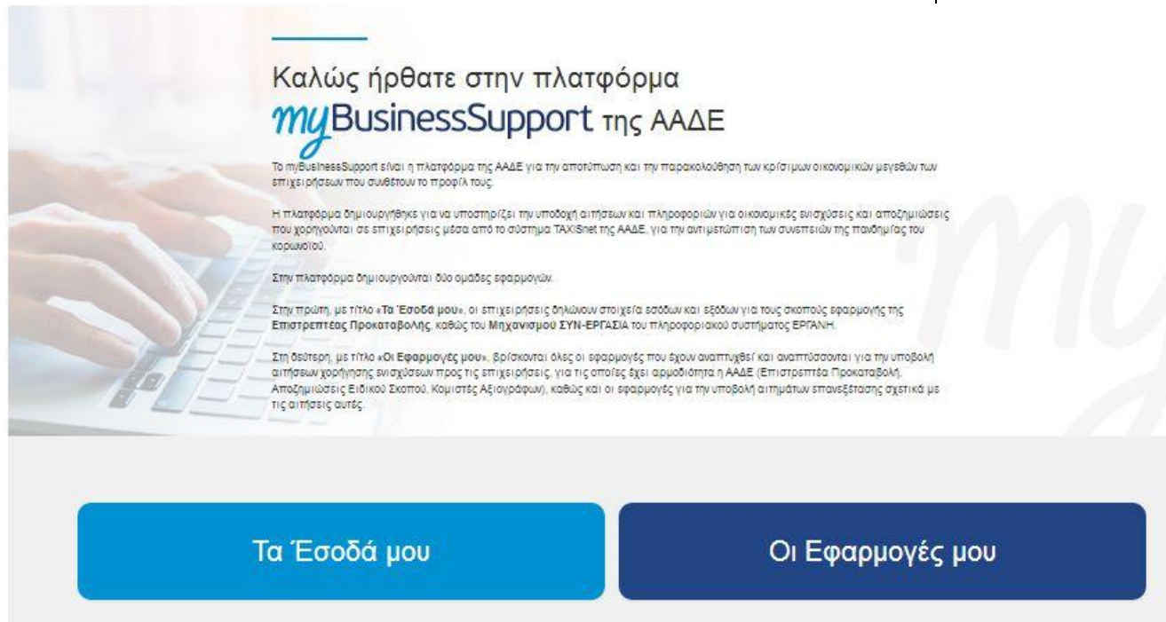
Εικόνα 1: Σελίδα της εφαρμογής στον διαδικτυακό τόπο της ΑΑΔΕ

Με την επιτυχή είσοδο στην εφαρμογή κατευθύνεστε στην επόμενη οθόνη και επιλέγετε «Επιστρεπτέα Προκαταβολή (5) Εκδήλωση Ενδιαφέροντος»